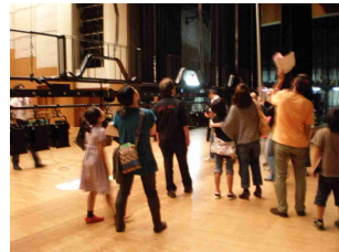
職員による舞台機構の説明

8月21日にプラザイーストのホールにて地域の親子を対象にバックステージツアーを開催しました。ホールの舞台はどのような仕組みになっているのかという疑問は、なかなか市販されている書籍などもなく、舞台に携わる人以外からすると興味がわく分野でもあります。また、地域にこのようなホールがあることをみなさんに知ってもらおうと「目指せ！未来の劇場人・劇場探検隊 2011」と称して開催するに至りました。プラザイースト職員からのホールの舞台機構、幕類などの吊り物及び照明器具等の説明と舞台スタッフによる調光室や音響調整室の説明を行い、調光室と音響調整室では実際に参加した親子にオペレートを体験していただきました。最後には平台、箱馬といった舞台道具で簡単な山台の作り方を説明し、その山台にのってみんなで記念撮影をしてツアーを終了しました。参加者からはあまり見ることのできない部分を見ることができ、楽しかったとの感想をいただきました。