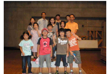
作った山台で記念撮影！