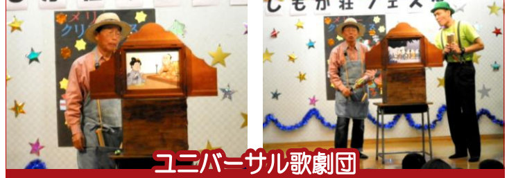
ユニバーサル歌劇団

日進西保育園の子どもたちによる可愛い演劇と、3B体操なでしこの皆さんによる体操発表、そして最後に、ユニバーサル歌劇団の情熱が入った紙芝居を披露していただきました。