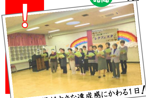
小さな目標が大きな達成感にかわる1日!