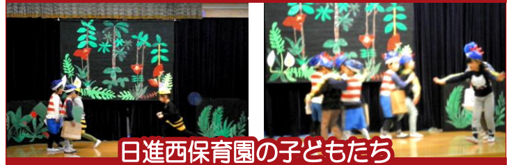
日進西保育園の子どもたち

去る12月13日(水)老人福祉センターしもか荘におきまして、しもか荘フェスタを開催しました。