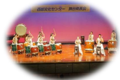
前回の舞台発表会の様子