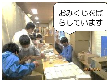
おみくじをばらしています