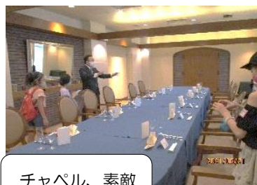
チャペル、素敵でした